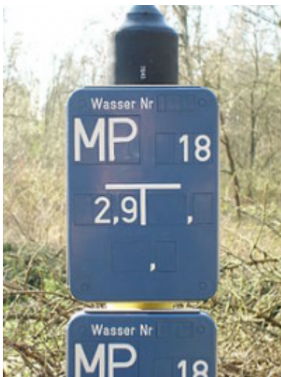
Hinweisschilder für Wassermesspunkte

Hinweisschild für den Schieber einer Leitung mit 40 Zentimeter Innendurchmesser (DN 400) bietet,