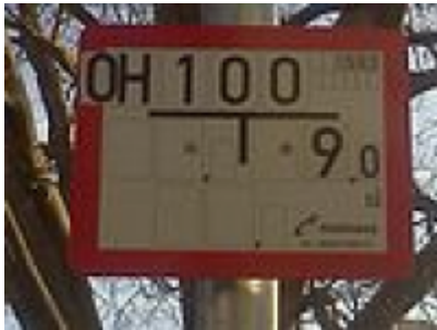
Hinweis auf einen Oberflurhydranten (OH) sowie den Betreiber (rechts unten Mainova)