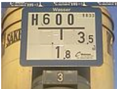
Blaues Hydrantenschild zum Hinweis, dass dieser Hydrant zusätzlich Be- und/oder Entlüftungseinrichtungen für die Leitungswartung besitzt