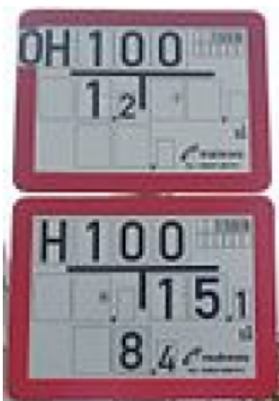
Hinweisschild auf Über- und Unterflurhydrantenschild in Frankfurt am Main